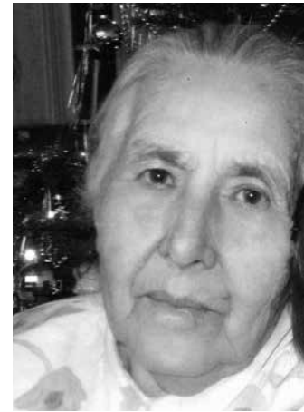
Meta Stier Pforzheim (DE)

„[...] sie haben ihn überwunden durch des Lammes Blut und durch das Wort ihres Zeugnisses [...]“