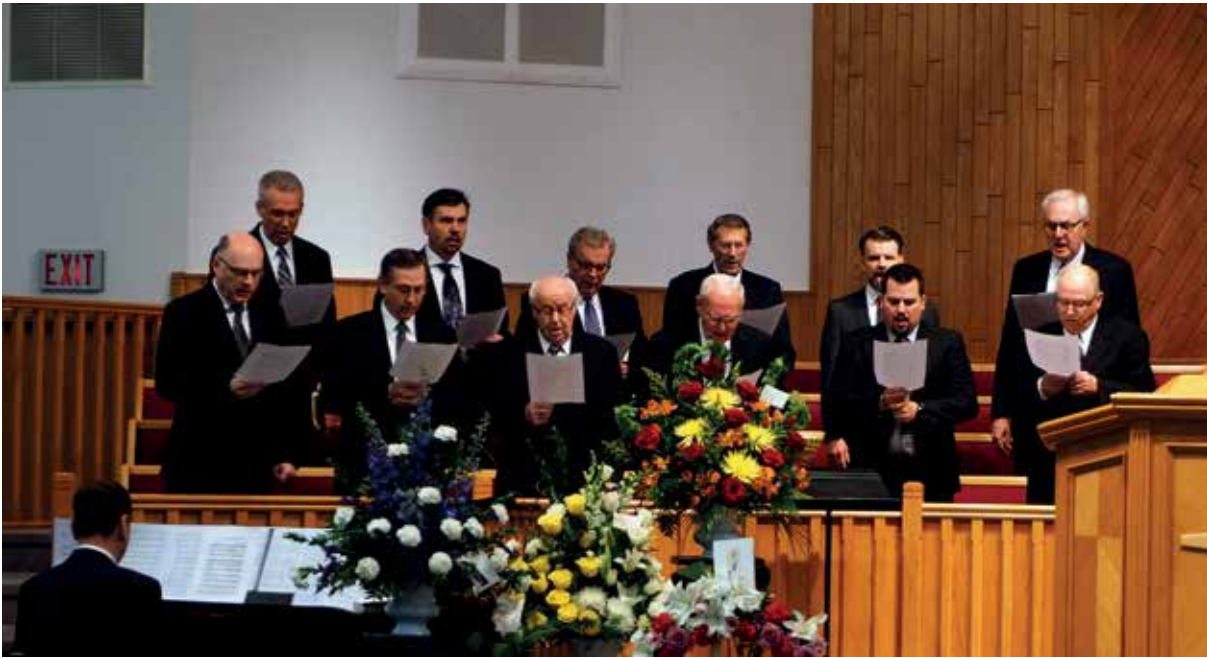
Die anwesenden Prediger bei der Trauerfeier.